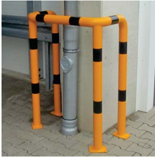
Hoekbeugel dubbel, voor in te betonnen