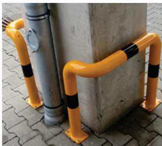
Hoekbeugel enkelzijdig, verdiepte uitvoering voor in te betonneren