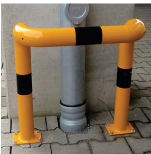
Hoekbeugel dubbelzijdig, verdiepte uitvoering voor in te betonnen